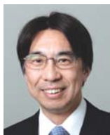
がん幹細胞とは何か? 佐谷秀行 慶應大学医学部先端医学研究所 遺伝子制御研究部門教授 15:10～15:35