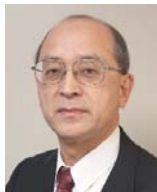
前立腺がんから おとうさんを守る 荒井陽一 東北大学病院泌尿器科教授 13:15～13:40