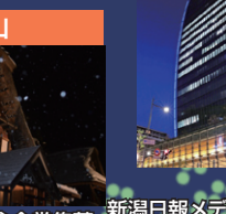
富山 世界遺産相倉合掌集落