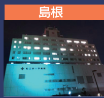
島根 松江赤十字病院

人は皆、がんという病に立ち向かう力をもっています。コロナ禍でがん医療を巡る課題が社会の中で浮き彫りになりました。いまこそ、UICCのネットワークを繋げて「誰ひとり取り残さないがん医療」を目指して、がんと社会のありようを皆さんと共に考えたいと思います。ワールドキャンサーデー・セッションがライトアップのあとに、HPで公開されます。(無料)