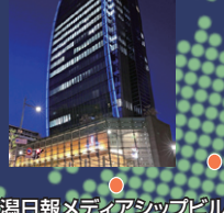
新潟 新潟日報メディアシップビル