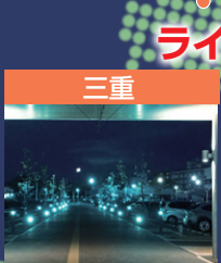
三重 三重大学医学部付属病院