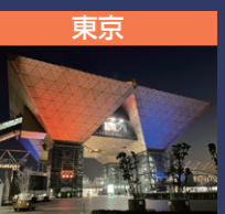
東京 東京ビッグサイト