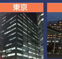
東京 日本対がん協会