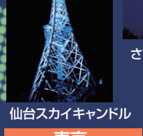
宮城 仙台スカイキャンドル