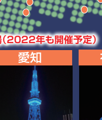
愛知 名古屋テレビ塔