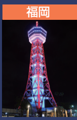
福岡 博多ポートタワー